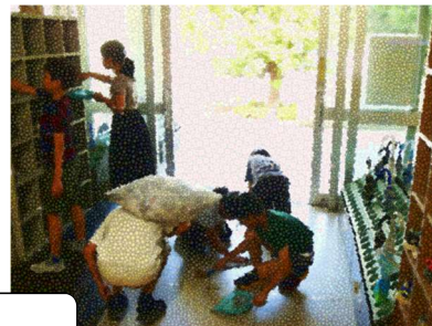
常盤小学校 低・中学年