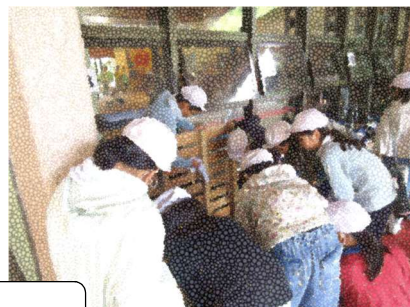
館岩少年自然の家 5年生

私は、次のように答えました。「ありがとうございます。常盤小は、人数の多い学校なので、普段の掃除から、一人当たりの受け持ち範囲が狭いのです。そこを一生懸命掃除するのがあたりまえで、低学年からずっと積み上げてきている結果だと思います。」